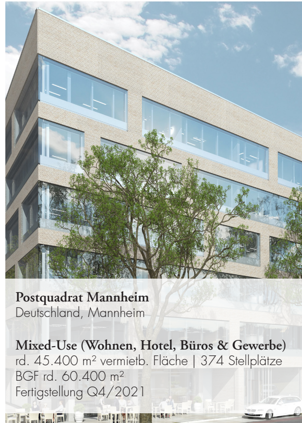
Postquadrat Mannheim Deutschland, Mannheim

Mixed-Use (Wohnen, Büros und Gewerbe) rd. 50.000 m 2 vermietb. Fläche | 706 Stellplätze BGF rd. 65.300 m 2 Fertigstellung Phase I | II Q3/2020 | Q3/2021