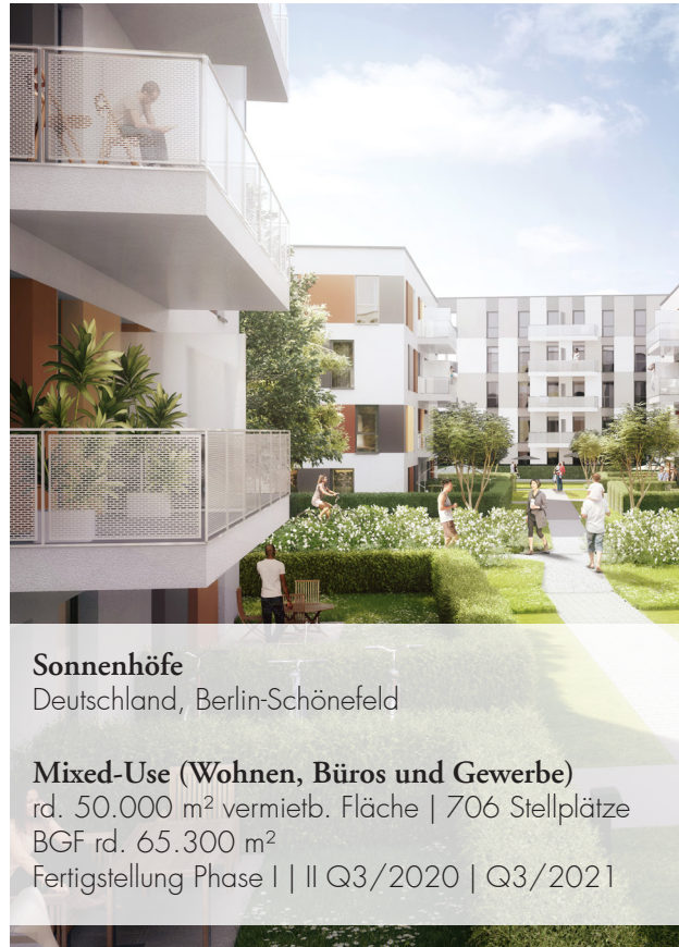
Sonnenhöfe Deutschland, Berlin-Schönefeld

Mixed-Use (Serviced-Apartments, Hotel, Gewerbe) rd. 22.900 m 2 vermietb. Fläche | 700 Stellplätze BGF rd. 42.000 m 2 Fertigstellung Q4/2022