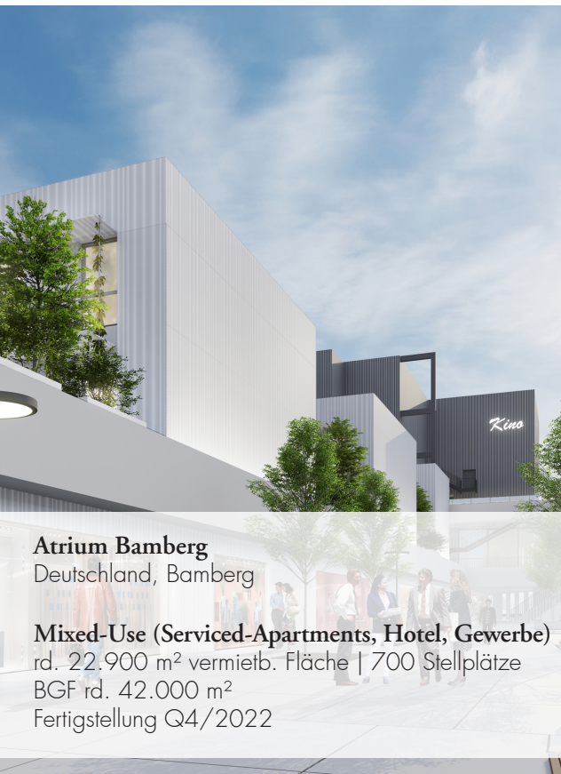
Atrium Bamberg Deutschland, Bamberg

Die Eyemaxx Real Estate Group ist seit über 20 Jahren erfolgreich als Immobilienprojektentwickler und Bestandshalter am Markt tätig – seit 2011 börsennotiert an der Börse Frankfurt, seit 2019 auch an der Börse Wien. Der Track Record ist lang: zahlreiche attraktive Projekte im In- und Ausland wurden realisiert und erfolgreich an Endinvestoren veräußert, an Eigen- und Vorsorgenutzer verkauft oder als Bestandsimmobilien eingegliedert. Die aktuelle Projektpipeline umfasst rund eine Milliarde Euro. Die Eyemaxx Real Estate Group beschäftigt derzeit rund 60 Mitarbeiter.