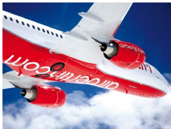
Air Berlin steigt in der Gewichtung im BondGuide Musterdepot.

Unsere aufgestockte Position Air Berlin III hat jetzt einen mittleren Kaufpreis (Gebühren sind berücksichtigt) von 103,05%. Wie bei Constantin sind beide Transaktionen der Übersichtlichkeit wegen zusammengefasst. Die beiden finalen Ausbuchungskurse von Eyemaxx I und Bastei Lübbe ergaben sich nunmehr zu 101,15% und 105,95%, jeweils wieder