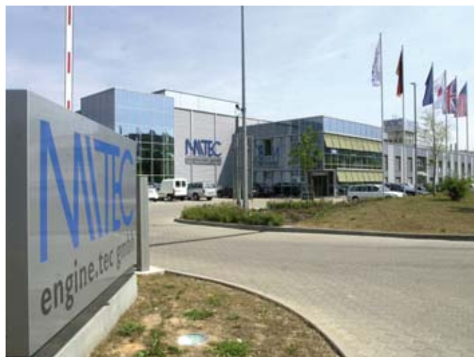
Hauptverwaltung von Mitec Automotive

Militzer: Ein erheblicher Teil soll in Wachstum, Entwicklung und Engineering fließen und dabei vor allem in unsere Standorte in China und den USA. Die OEMs verlangen heute, dass man vor Ort ist, um schnell und flexibel reagieren zu können. Ohne unser neues Werk in Ohio hätten wir nie den letzten Großauftrag von GM erhalten. In unserer Branche öffnet sich die Tür zu neuen Projekten zudem immer über die Technologie. Daher zählt die Akquisition von Firmen und Engineering-Kapazitäten auch zu den Zielen, die wir mit den Mitteln aus der Anleihe umsetzen möchten. Statt Umsatz zuzukaufen, setzen wir auf die Übernahme von technischem Know-how. Im Moment befinden wir uns bereits in der Due Diligence mit einem Unternehmen, das zu uns passen könnte. Unsere