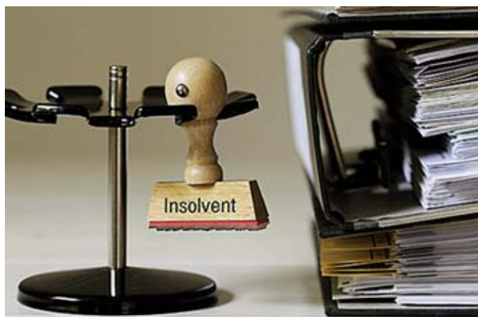
Hohe Verluste in den USA, eine von Finanz- und Wirtschaftskrise verursachte Unterbeschäftigung in den Vorjahren sowie Verzögerungen in der Projektabwicklung befeuerten den SIAG-Konkurs.

Neben MT-Energie starteten zu Wochenbeginn auch die börslichen Zeichnungsfristen für die Unternehmensanleihen von Mitec Automotive (siehe S. 24), Eyemaxx Real Estate (siehe S. 18) und Golfino. Letzterer der vier Bondemittenten konnte seine Orderbücher bereits am ersten Angebotstag »