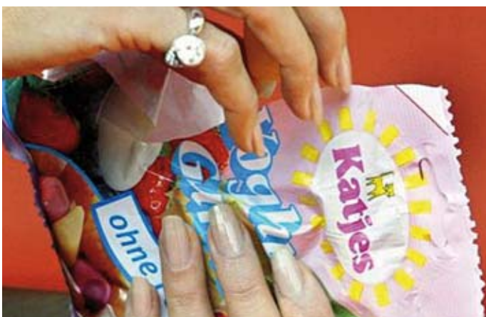
Bei der Aufstockung der Katjes-Anleihe griffen Bond-Investoren abermals beherzt zu.

sodann 45 Mio. EUR vorgesehen. Unterdessen gab Katjes die vollständige Übernahme des Salbei-Bonbonherstellers Dallmann & Co. Fabrik pharm. Präparate bekannt.