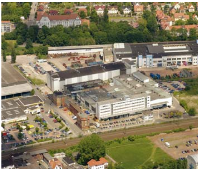
Sitz der Mitec Automotive AG in Eisenach