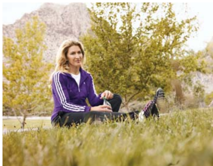
Die prominente Werbeträgerin Steffi Graf mit ihrer neuen Sport-Kollektion bei Otto.

Das Versandhaus Otto emittiert erstmals eine Unternehmensanleihe am Dritten Markt der Wiener Börse. Bis zu 150 Mio. EUR plant das Hamburger Unternehmen vornehmlich bei Privatanlegern einzusammeln, die auch mit der Stückelung von 1.000 EUR angesprochen werden sollen. Der Kupon der 5-jährigen Anleihe liegt bei 4,625%. Die Zeichnungsfrist hat bereits am 22. März begonnen und endet spätestens am