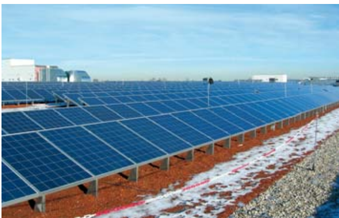
S.A.G.-Anlage in Landsberg

S.A.G. II, derzeit auf depressivem Kurs von rund 75%, ist unsere einzige aktuelle Exponierung im problematischen Solarsektor und dabei soll es auch bleiben. Die laufende Verzinsung von 10% (nicht zu verwechseln mit der Rendite bis zur Fälligkeit, denn die beträgt über 14%) erscheint attraktiv, wenn man berücksichtigt, dass S.A.G. Solarstrom ein Energiedienstleister ist und nicht etwa Solarmodule oder dergleichen herstellt. Auch die Freiburger werden im aktuellen Klima Federn lassen, aber nicht dergestalt, dass wir die beiden Anleihen gefährdet sehen. Falls wir uns täuschen, ist der