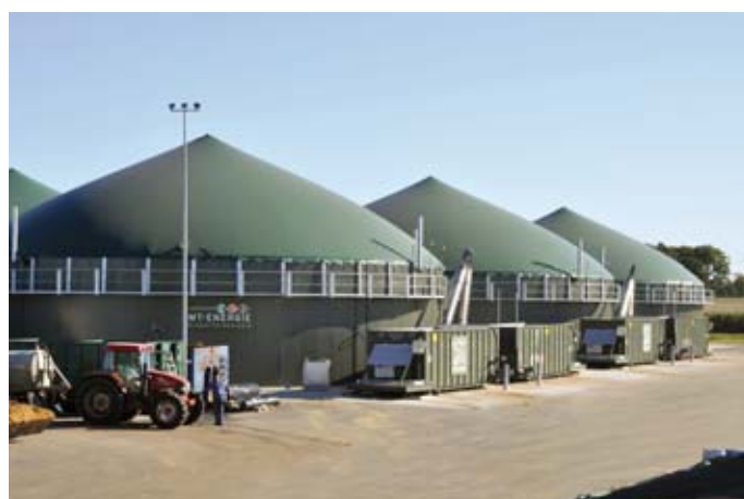
Um nicht in Konkurrenz mit den eigenen Kunden zu treten, verzichtet MT-Energie auf den Eigenbetrieb von Biogasanlagen.

Noch bis spätestens 30. März bietet die im niedersächsischen Zeven ansässige MT-Energie GmbH bis zu 30.000 auf den Inhaber lautende Teilschuldverschreibungen im anteiligen Nennbetrag von je 1.000 EUR öffentlich zum Kauf an (siehe auch BondGuide #05/2012). Der nicht dinglich besicherte Bond bietet einen Festzins von 8,25% p.a. Neben den gängi-