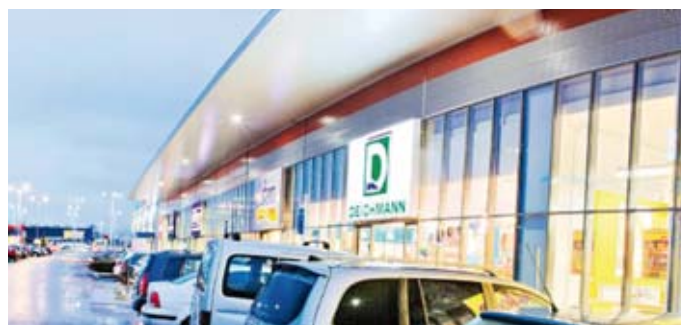
Eyemaxx-Projekt in der Slowakei: Fachmarktzentrum Trencin

Verzinst wird dieser neue Eyemaxx-Bond mit 7,75% per annum (Eyemaxx I: 7,5%). Creditreform bewertet ihn mit BBB+, die bislang zweithöchste Rating-Note für eine deutsche Mittelstandsanleihe. Damit bietet sie Anlegern ein attraktives Rendite-Risiko-Verhältnis. Die Anleihe kann seit dem 19. März gezeichnet werden. Mit einer Stückelung von 1.000 EUR richtet sich das Angebot auch an Privatanleger. Die VEM Aktienbank begleitet die Transaktion als Lead-Manager. Erwähnenswert ist das engmaschige Sicherungskonzept: „Wir haben uns verpflichtet, keine Gewinnausschüttungen vorzunehmen, durch die das Eigenkapital unter 14 Mio. EUR sinken würde“, betont Dr. Michael Müller, Firmengründer, Mehrheitsaktionär und Vorstand der Eyemaxx Real Estate AG im Gespräch mit dem BondGuide. „Zudem erhalten Gläubiger eine im Grundbuch eingetragene Absicherung von bis zu 16 Mio. EUR durch zusätzliche Immobilien, die überwiegend aus meinem Privateigentum stammen“, so Müller. Darüber hinaus sind Mieteinnahmen