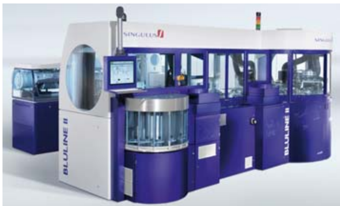
Mit den eingesammelten Mitteln plant Singulus u.a. die beiden Geschäftsbereiche Optical Disc und Solar durch gezielte Investitionen in F&E sowie strategische Partnerschaften auszubauen.

Zur Umsetzung künftiger Expansionsvorhaben hat die Akquisitionsgesellschaft des Süßwarenherstellers Katjes Fassin, die Katjes International GmbH & Co. KG, ihre im Juli vergangenen Jahres begebene 30-Mio.-EUR-Unternehmensanleihe kürzlich um weitere 15 Mio. EUR aufgestockt (siehe auch BondGuide #04/2012). Das Bondangebot wurde prospektfrei im Wege einer Privatplatzierung innerhalb von nur zwei Stunden vollständig an institutionelle Investoren abgegeben. Börsenstart der neuen Schuldverschreibungen im Düsseldorfer mittelstandsmarkt war am 15. März, der Ausgabekurs lag bei 103,5%. In Kürze ist die Verschmelzung der 15.000 zusätzlichen Teilschuldverschreibungen auf die seit dem 5. Juli 2011 börsengehandelte Katjes-Anleihe – Festzinskupon: 7,125% p.a., Endfälligkeit am 19. Juli 2016 – auf »