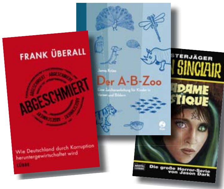
Breitgefächertes Buchangebot: Bastei Lübbe

rum unter Berücksichtigung von 25 Basispunkten Transaktionsgebühren, die wir vom Verkaufserlös abziehen. Beide steuerten zusammen rund 1,1 Prozentpunkte zur Musterdepotperformance bei – eine solide Sache. Beide Verkäufe waren, wie im letzten BondGuide erläutert, nicht unternehmensbedingt – wie bei SiC Processing. Im Gegenteil: Eyemaxx II empfehlen wir zur Zeichnung (siehe Seiten 18–20).