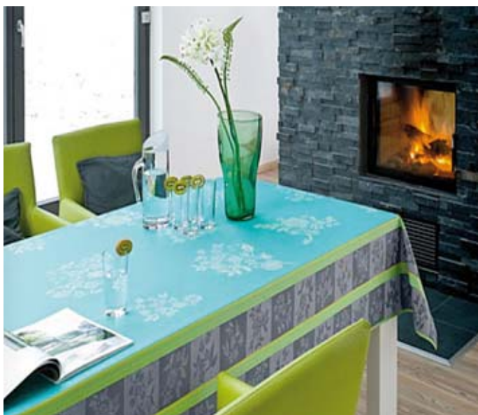
Tischbeläge gehören zum Produktportfolio von friedola.