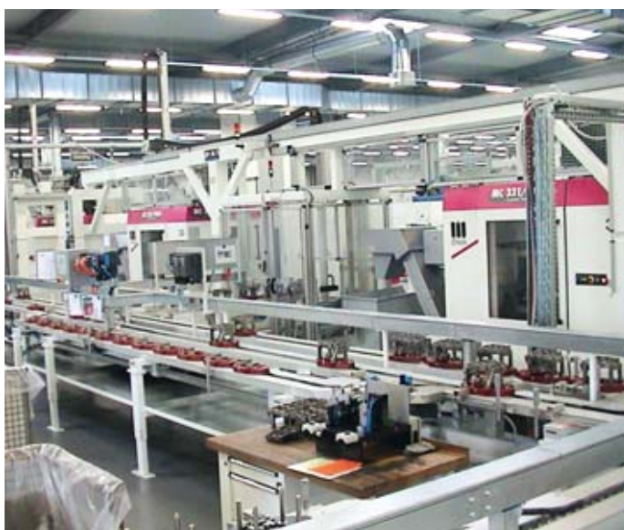
Blick in die Produktion von Mitec

Militzer: Obwohl unsere Zahlen noch nicht vorliegen, lässt sich schon sagen, dass wir beim Umsatz auf eine Zielgröße von rund 140 Mio. EUR zusteuern. Das wäre ein leichtes Plus gegenüber dem Vorjahr. Gleichzeitig erwarte ich trotz Anlaufkosten für unser Werk in Ohio eine Rendite um das Niveau »