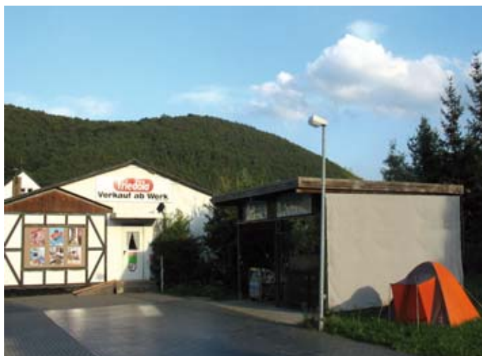
Werksverkauf in Meinhard-Frieda

BondGuide: Warum haben Sie sich für die Finanzierung über eine Anleihe entschieden?